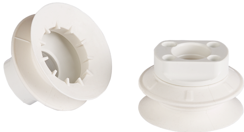
Sauggreifer für Strömungsgreifer SFG